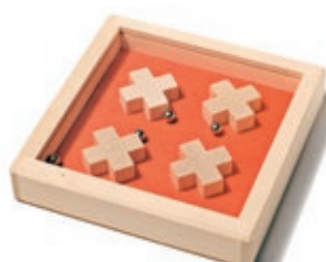
321 Geduldspiel Swiss