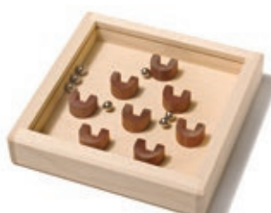
320 Geduldspiel mit 8 Kugeln