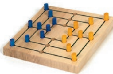
309 Mühlespiel div. Farben