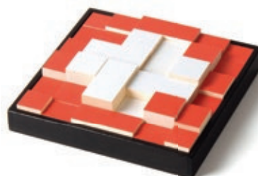
315 Knobelkreuz Design: Christina Brisset

Die Klötzchen sind auf einer Seite weiss, auf der anderen rot gefärbt. Mit Geduld und Fantasie kann der Spieler eine Vielzahl von Mustern legen.