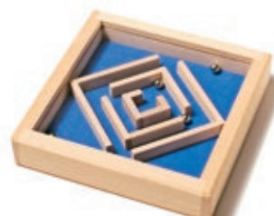
322 Geduldspiel Diagonal