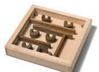
323 Geduldspiel mit 5 Kugeln