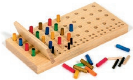
305 Master Mind