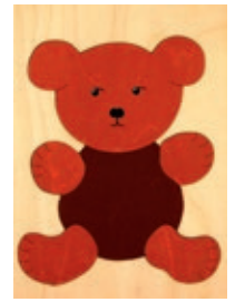
122-06 Teddy braun 6 Teile