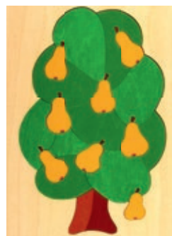
115 Birnbaum 11 Teile