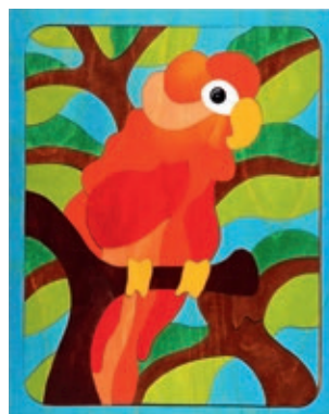
143 U-Linie Papagei 62 Teile