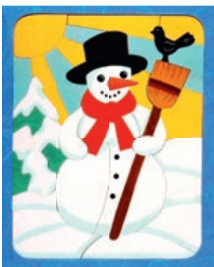
142 U-Linie Schneemann 50 Teile