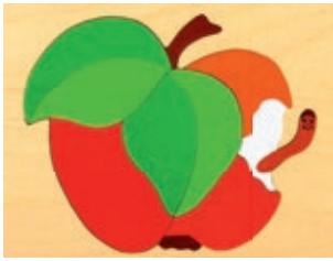
120 Apfel mit Wurm 8 Teile