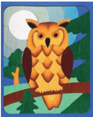
140 U-Linie Uhu 65 Teile