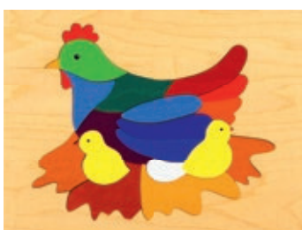
117 Huhn mit Küken 15 Teile