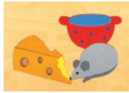
121 Maus 5 Teile