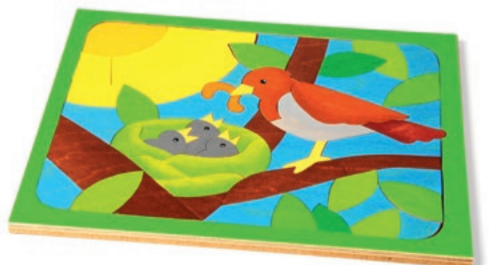
145 U-Linie Vogelnest 58 Teile