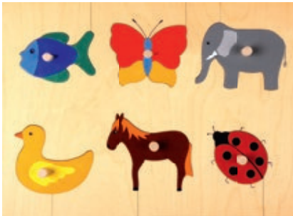
130 Griffpuzzle Tiere 6 Teile