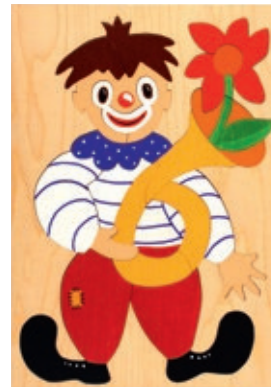
104 Clown mit Blume 21 Teile