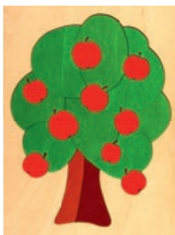
114 Apfelbaum 10 Teile