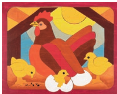
141 U-Linie Huhn 49 Teile