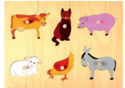
132 Griffpuzzle Bauernhoftiere 6 Teile