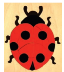
119 Marienkäfer 10 Teile