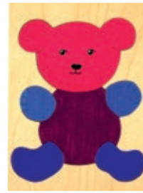
122-00 Teddy farbig 6 Teile