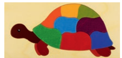
113 Schildkröte 11 Teile