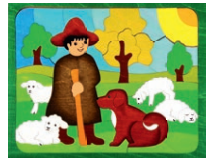
144 U-Linie Schäfer 64 Teile