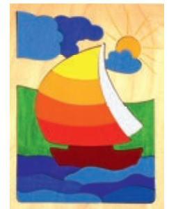
110 Segelschiff 17 Teile