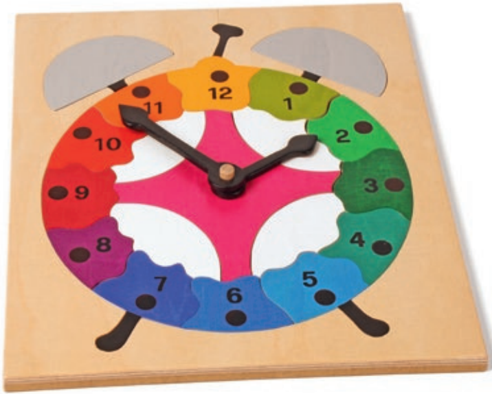
103 Wecker 19 Teile