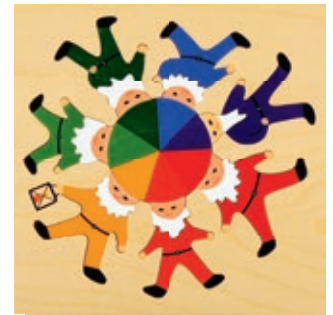
105 Sieben Zwerge 14 Teile