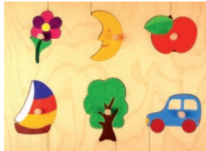
131 Griffpuzzle Welt 6 Teile