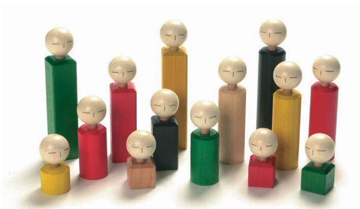
802 Holzfiguren Set (40 Stk.)