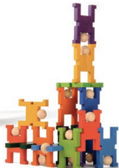
633 ACROMAX klein

15 Figuren, Körper natur, Kopf farbig Figur 8x6x1cm