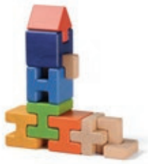
651 Castello Turm