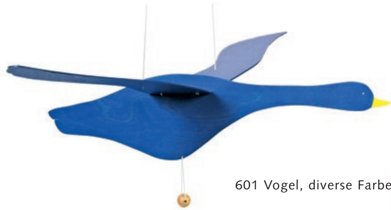
601 Vogel, diverse Farben