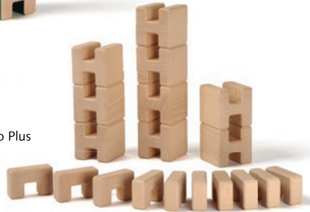
659 Castello Plus