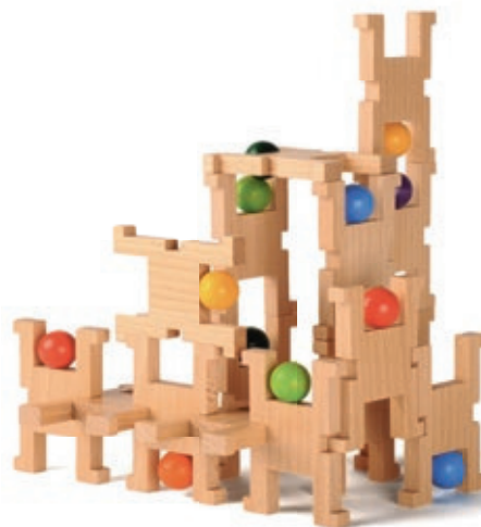
632 ACROMAX klein

15 Figuren, Körper und Kopf natur Figur 8x6x1cm