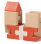
653 Castello Swiss