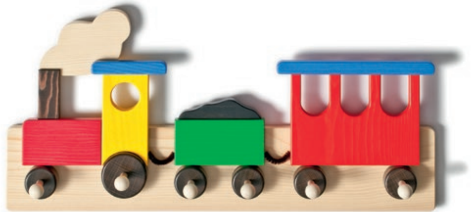
605 Garderobe Eisenbahn farbig