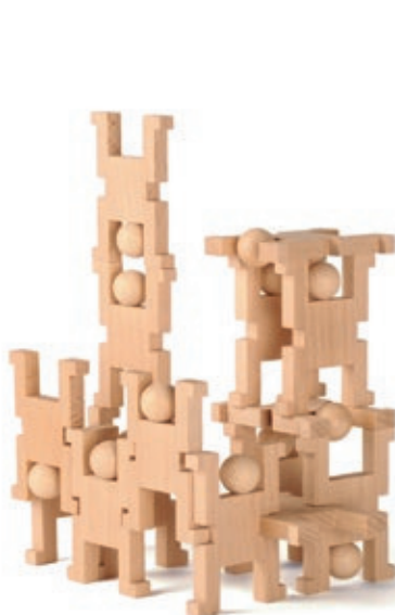
631 ACROMAX klein

15 Figuren, Körper und Kopf natur Figur 8x6x1cm