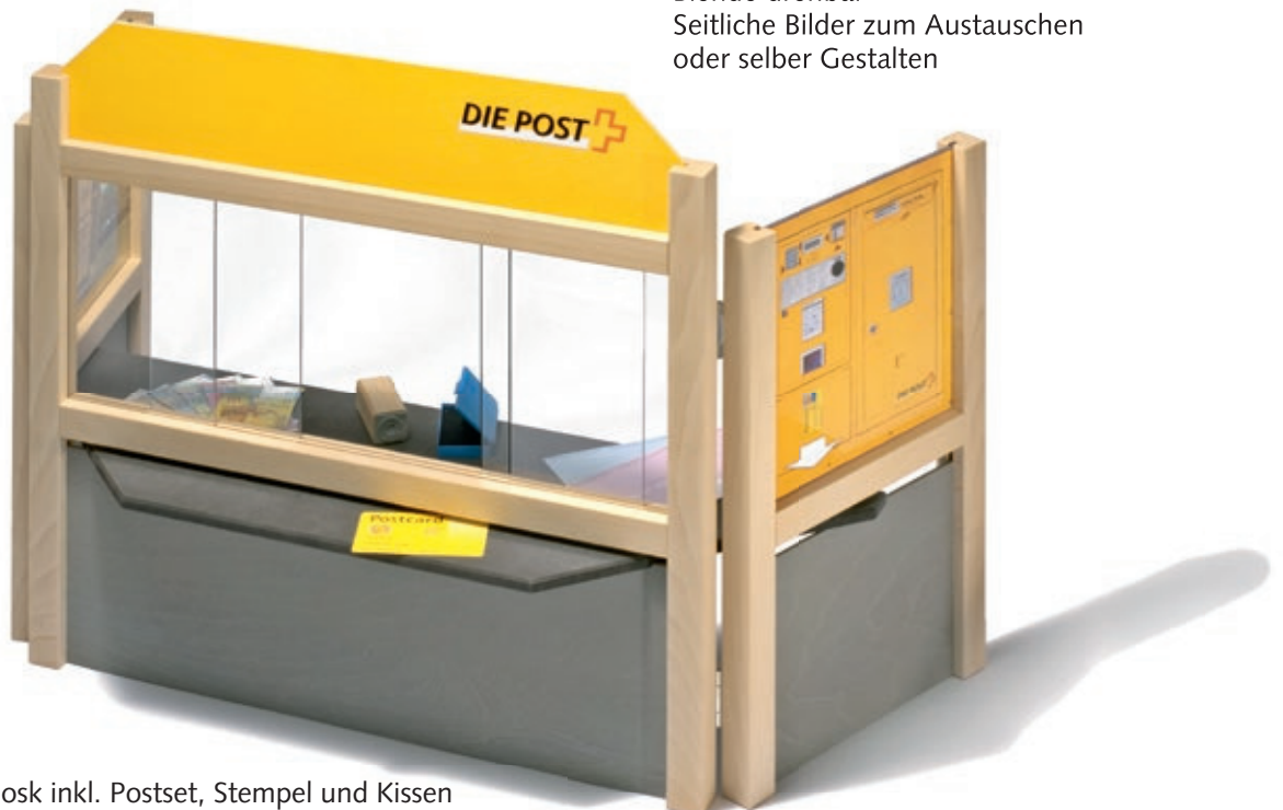
626 Postschalter/Kiosk inkl. Postset, Stempel und Kissen

Blende drehbar Seitliche Bilder zum Austauschen oder selber Gestalten