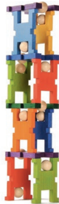
643 ACROMAX gross - 16 Figuren Körper farbig, Kopf natur Figur 12x8x1.5cm

ACROMAX ist ein Holzspielzeug zum Stecken, Stapeln und Stellen. Das Spiel kommt mit einer einzigen Spielfigur aus, die sich auf verschiedenste Weise mit weiteren gleichen Spielfiguren kombinieren lässt: kreuz und quer, übereinander oder nebeneinander.