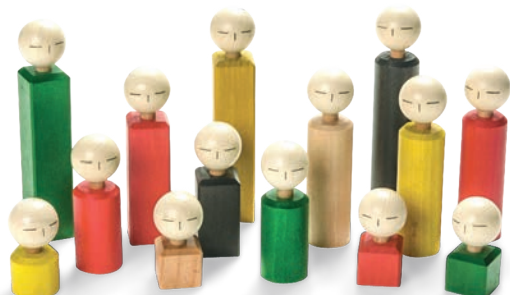
802 Holzfiguren Set (40 Stk.) 802 Bonhommes en bois - set (40 pcs.)

25 Dés – 5 couleurs – 5 grandeurs – 5 sonores Par le jeu et l'exercice, développer les compétences suivantes former et encourager : - perception et mémoire - la pensée logique - écoute exacte - compétences linguistiques - comportement social