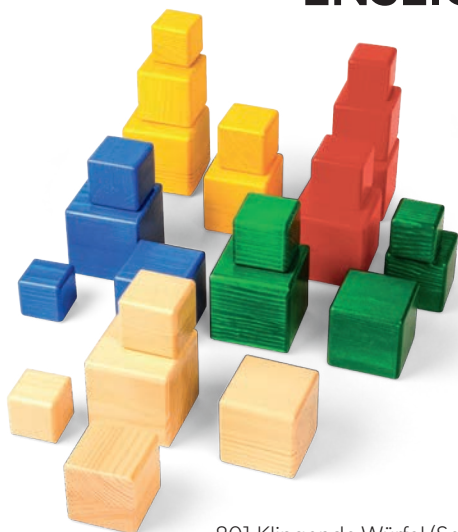
801 Klingende Würfel (Set)

25 Würfel – 5 Farben – 5 Größen – 5 Klänge Durch Spiel und Übung folgende Kompetenzen schulen und fördern: - Wahrnehmung und Gedächtnis - logisches Denken - exaktes Hinhören - Sprachkompetenz - soziales Verhalten